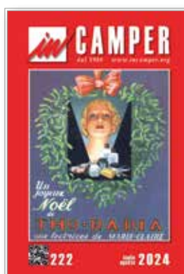
2024, gli ultimi numeri