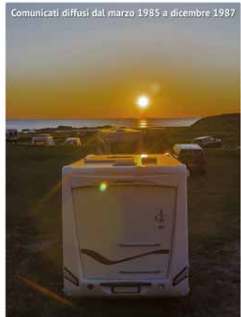
Comunicati diffusi dal marzo 1985 a dicembre 1987