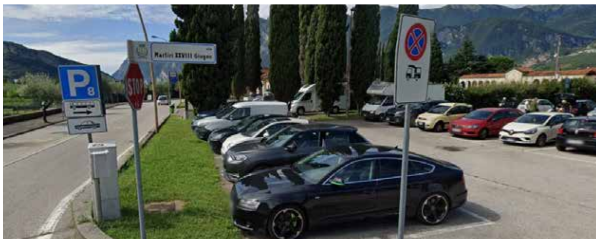
foto che evidenzia una atto in violazione di legge: una segnaletica stradale verticale di divieto di fermata e di sosta diretto solo alle autocaravan

24 giugno 2025 l'ASSOCIAZIONE NAZIONALE COORDINAMENTO CAMPERISTI invia istanza denuncia per azioni in violazione di legge e assenza del piano comunale di protezione civile