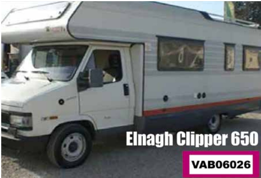
Elnagh Clipper 650