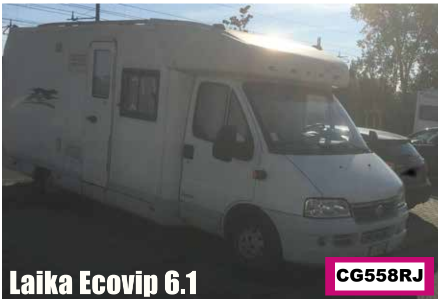
Laika Ecovip 6.1