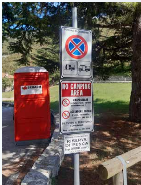
La segnaletica oggetto di rimozione

Detto annuncio impegna i camperisti ad aprire ogni 7 giorni https://www.comune.cavedine.tn.it/ per controllare se nell'ALBO PRETORIO è presente l'ordinanza annunciata.