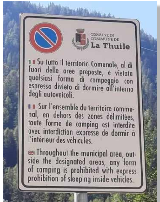
Segnaletica in violazione di legge ora da far rimuovere.

Come sviluppare il turismo (inserito in www.incamper.org ) da inviare al Governo, ai parlamentari, alla propria Regione, al proprio Sindaco e agli organi d'informazione.