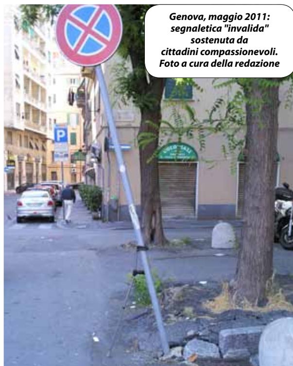
Genova, maggio 2011: segnaletica "invalida" sostenuta da cittadini compassionevoli.

L'enunciazione di massima di tale pronunciamento succintamente riferisce: "In tema di sanzioni amministrative per violazioni del codice della strada, deve essere esclusa la proponibilità, da parte del Comune, del ricorso in opposizione, ex art. 22 della legge 24 novembre 1981, n. 689, avverso l'ordinanza di archiviazione degli atti emessa dal prefetto, ai sensi dell'art. 204, primo comma, del Codice della Strada, sul ricorso proposto ex art. 203 del Codice della Strada dal presunto trasgressore, ovvero dagli altri soggetti indi-