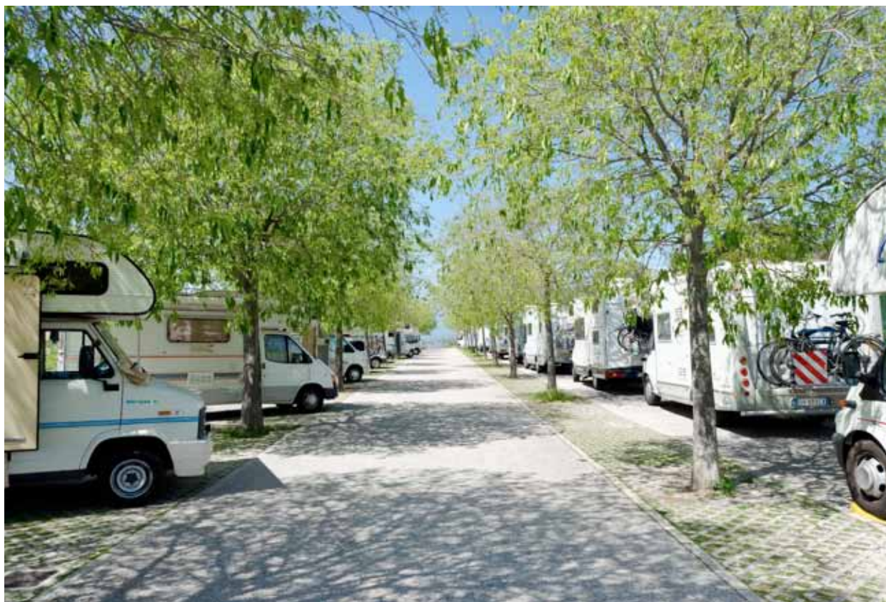
Esempio di autocaravan in sosta regolare a pettine e longitudinale a Trevi (Pg)