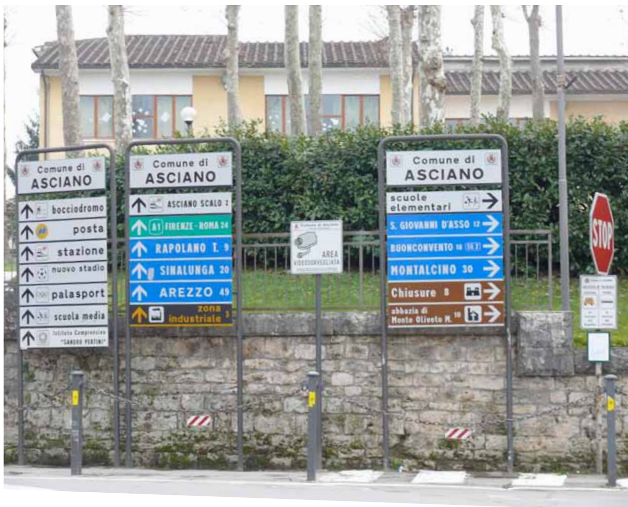
Segnaletica in violazione di legge: chi paga?