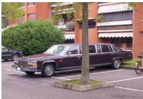
In questa pagina due esempi di dimensioni dello stallone che ne impediscono la fruizione

Prescindendo dal disposto di cui all'art. 6, co. 4 lett. b), si ricorda che ai sensi dell'art. 3 della legge n. 241/90 ogni provvedimento amministrativo, salvo gli atti