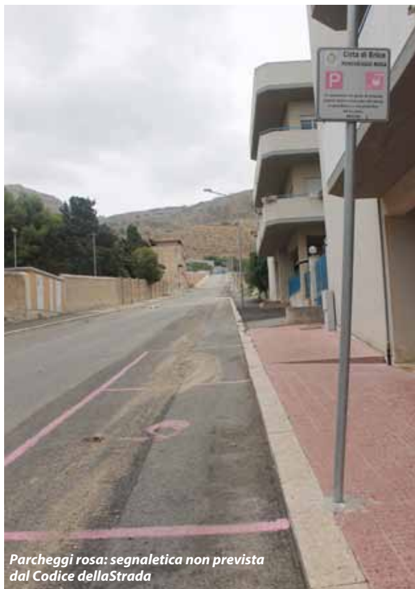
Parcheggi rosa: segnaletica non prevista dal Codice della Strada

Nel caso specifico degli stalloni di sosta longitudinali lungo le strade, al fine di consentire la possibilità di sosta a tutti i veicoli e di ottimizzare le superfici di parcheggio disponibili, senza incorrere in probabili vizi di legittimità del relativo provvedimento amministrativo, in special modo per eccesso di potere, si ritiene necessario realizzare stalloni di sosta delimitati unicamente per larghezza, in modo che tutti, a prescindere dal veicolo che utilizzano possono fruire dell'area di sosta.