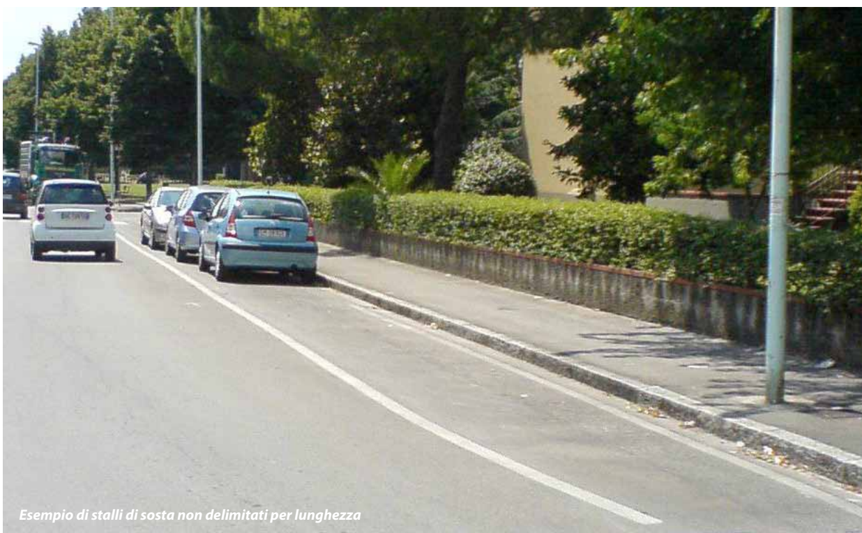
Esempio di stalli di sosta non delimitati per lunghezza