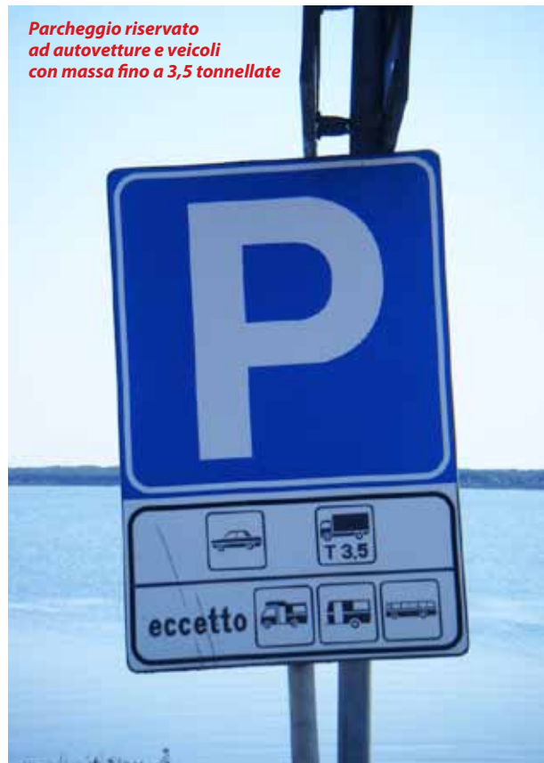
Parcheggio riservato ad autovetture e veicoli con massa fino a 3,5 tonnellate