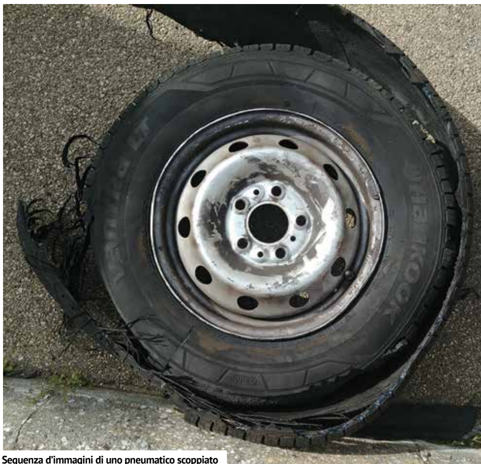
Sequenza d'immagini di uno pneumatico scoppiato