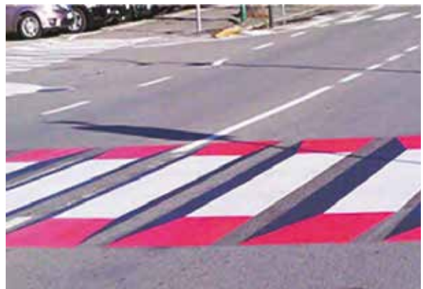
Strisce pedonali realizzate su fondo stradale con colorazione non conforme a legge