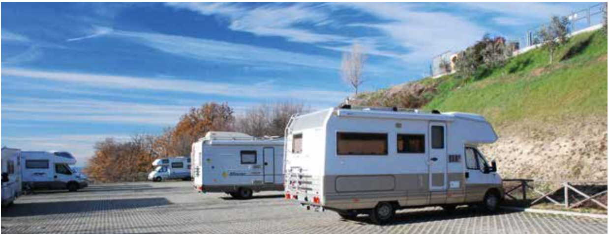
L'area attrezzata di Montefalco