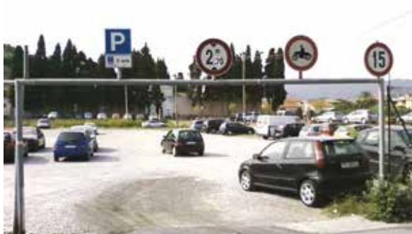
Esempi di impiego non corretto di sbarra ad altezza ridotta dalla sede stradale con divieto di transito per altezza