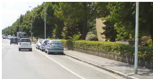
Area ove è permessa la sosta longitudinale su strada, senza delimitazione della lunghezza degli stalli di sosta