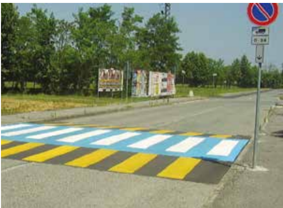
Attraversamento pedonale rialzato non conforme a legge

dale orizzontale, piani di manutenzione completi di tempi e costi) affinché sia visibile (segnaletiche ben distinguibili dall'ambiente che le circonda con adeguato illuminamento e luminanza) quale flusso informativo, tempestivo e comprensibile per chi guida al fine di adeguarsi alle prescrizioni; un sistema essenziale anche per la guida autonoma che è in parte già in atto (navigatori, sensori di distanza tra veicoli, sensori che interpretano la segnaletica stradale orizzontale comunicandolo al guidatore e sempre di più lo sarà negli autoveicoli che tra pochi anni potranno essere guidati da sistemi esterni.