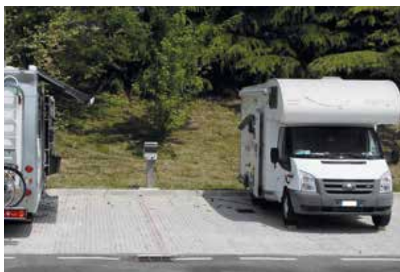
ROBILANTE (CN): area attrezzata per parcheggiare le autocaravan