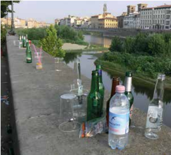
Firenze, i vuoti lasciati dopo una notte da sbalzo