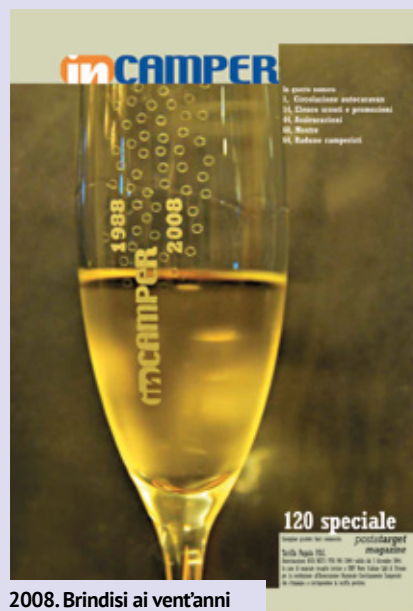
2008. Brindisi ai vent'anni