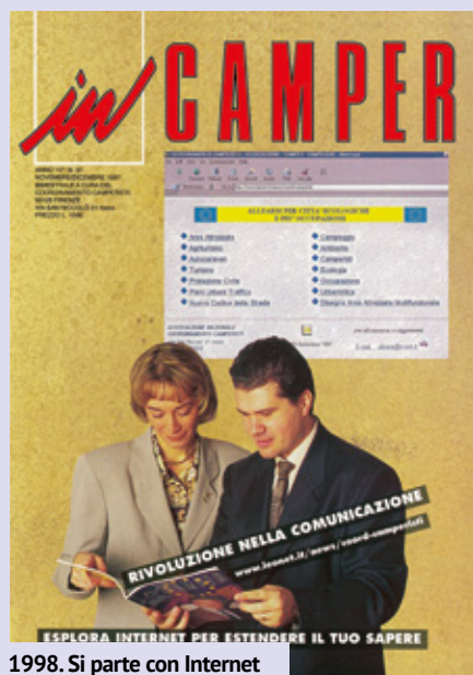
1998. Si parte con Internet