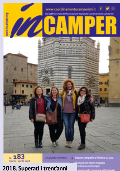
2018. Superati i trent'anni