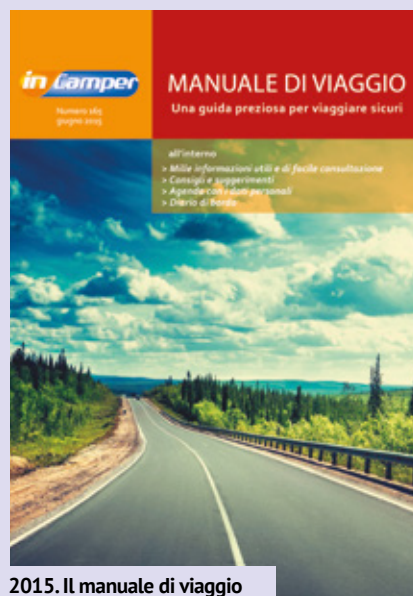
2015. Il manuale di viaggio