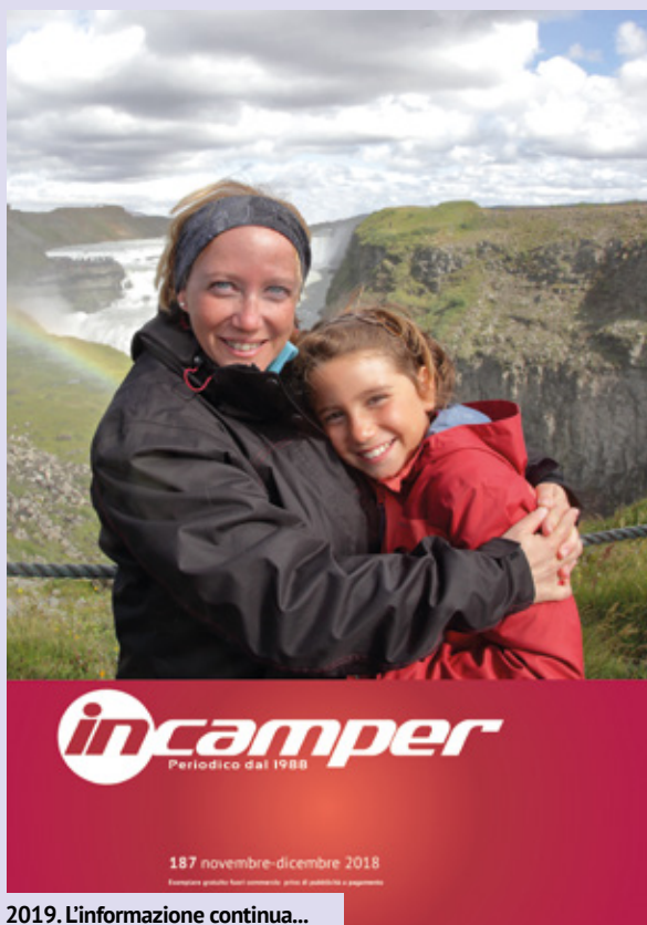
2019. L'informazione continua...

Infatti, con il versamento del contributo sociale si votano sia le cariche sociali sia lo Statuto che segue nonché l'espresso consenso al trattamento dei dati personali anche dopo la scadenza della tessera sociale, sino alla revoca del consenso da parte dell'interessato ovvero alla cancellazione dei dati a seguito delle operazioni di verifica periodica a cura dell'Associazione. Il Titolare del trattamento dei dati è l'Associazione Nazionale Coordinamento Camperisti con sede legale a Firenze in via San Niccolò 21 (telefono 0552469343 - telefax 0552346925 mail privacy@coordinamentocamperisti.it ; PEC ancc@pec.coordinamentocamperisti.it ). Le informazioni integrali relative al trattamento dei dati sono consultabili sul sito internet www.coordinamentocamperisti.it .